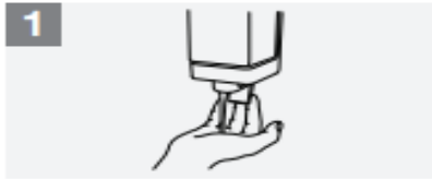
1 Apply enough soap to cover all hand surfaces;