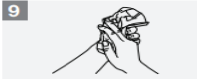
9 Dry hands thoroughly with a single use towel;