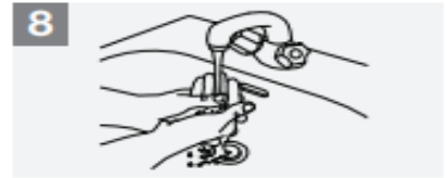
8 Rinse hands with water;