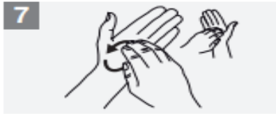
7 Rotational rubbing, backwards and forwards with clasped fingers of right hand in left palm and vice versa;