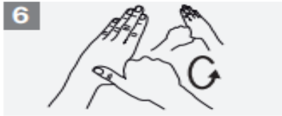
6 Rotational rubbing of left thumb clasped in right palm and vice versa;