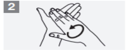
2 Rub hands palm to palm;