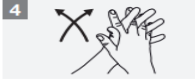
4 Palm to palm with fingers interlaced;