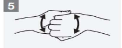
5 Backs of fingers to opposing palms with fingers interlocked;