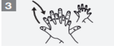
3 Right palm over left dorsum with interlaced fingers and vice versa;