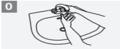
0 Wet hands with water;